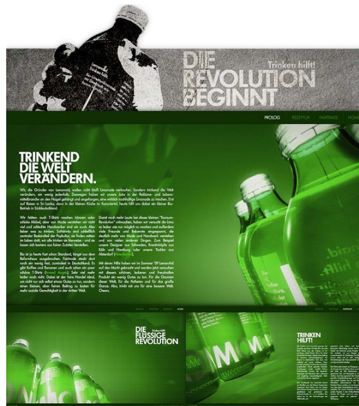
Auch im Netz zu finden: LemonAid Webseite

Erhältlich ist die „Revolution aus der Flasche“ seit Juni 2009 in ausgewählten Kneipen und Restaurants in Deutschland, sowie in den Hamburger Edeka-Filialen der Betreiber Niemersehn & Co. Passend zum Sommer gibt es die flüssige Entwicklungshilfe nun auch „in gelb“ zu trinken mit Maracuja-Flavour.